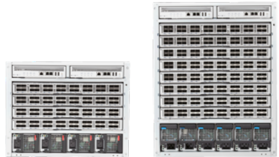
Arista 7300X 系列机箱

中段面板完全是被动的，提供控制面板到交换矩阵模块和线卡模块的连接。系统针对数据中心部署进行了最优化，提供前端到后端和后端到前端两种气流选项。