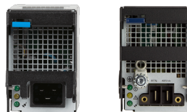
Arista 7300X 系列电源

交流电源符合额定的 platinum 或 Titanium Climate Saver 金牌认证，具有超过 93% 的效率，可通过单个阶段转换为内部直流电压。直流电源需要输入 -48V DC 才能提供高达 3000W 的功率。7300 系列使用多个小型电源，从而可实现增量配置和较小的输入电流。可变的电源风扇速度可确保优化电源效率并减少数据中心环境中的噪声。