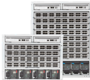
Arista 7300X 系列模块化数据中心交换机

系统采用前端到后端或后端到前端的可逆气流方向、冗余热插拔管理引擎以及电源、交换矩阵和冷却模块, 专为数据中心而设计。7300 系列的能源效率很高, 机箱满负载时, 每个 10GbE 端口的典型功耗低于 3 瓦。由于具备这些特性, Arista 7300 已成为构建高可靠性、低延迟、高弹性和可伸缩数据中心网络的理想平台。若结合 Arista EOS 使用, 7300 系列能为大数据、云服务以及虚拟和传统设计提供高级性能。