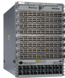
Arista 7800R 系列模块化数据中心交换机

所有组件均为热插拔, 配有前端到后端气流的冗余管理引擎、电源、交换矩阵和冷却模块。该系统专用于数据中心且能源效率极高, 满载机箱每个 100G 端口的典型功耗低于 25 瓦, 400G 端口的典型功耗低于 50 瓦。由于具备这些特性, Arista 7500R 已成为构建可靠及较高可伸缩数据中心网络的理想平台。